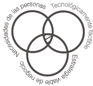
Ilustración 1 Necesidades de las personas, Tecnológicamente factible, Estrategia Viable de Negocio

productos o servicios hasta la mejora de procesos o la definición de modelos de negocio. Su aplicabilidad tiene como límites nuestra propia imaginación.